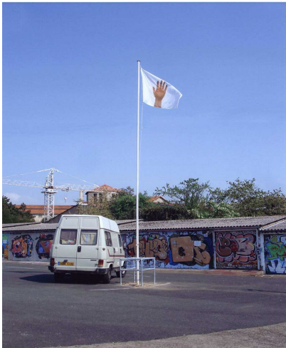
Untitled (Hand waving to the wind /Dream Recall) , 2007 Court. Galerie Andrew Kreps, New York, Emmanuel Perrotin, Paris, Herald St., Londres.