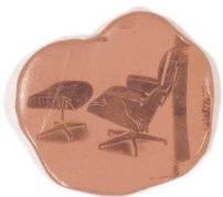
Untitled (Imprints) , 2005