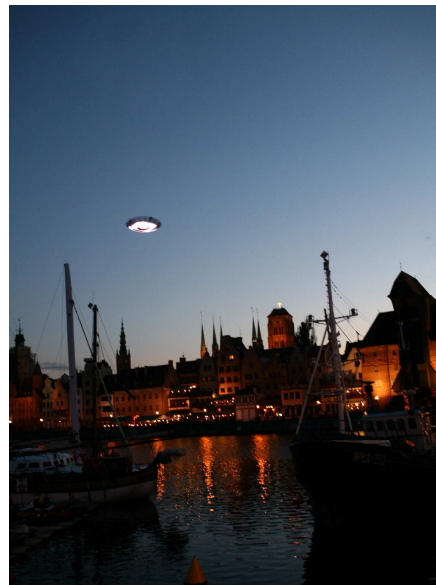
Untitled (U.F.O.) , 2008