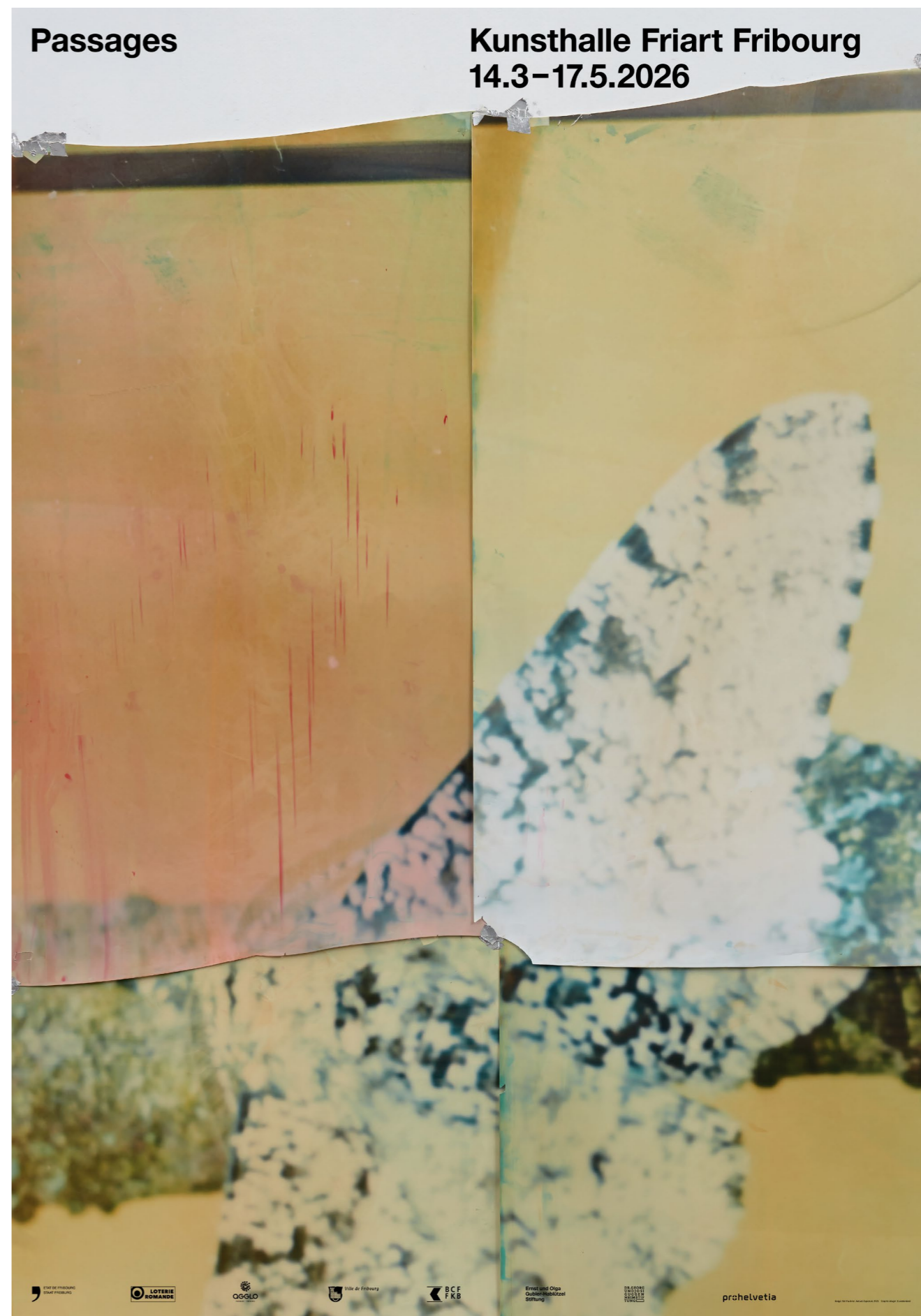
Ausstellungsposter, Grafikdesign: Eurostandard, 2026