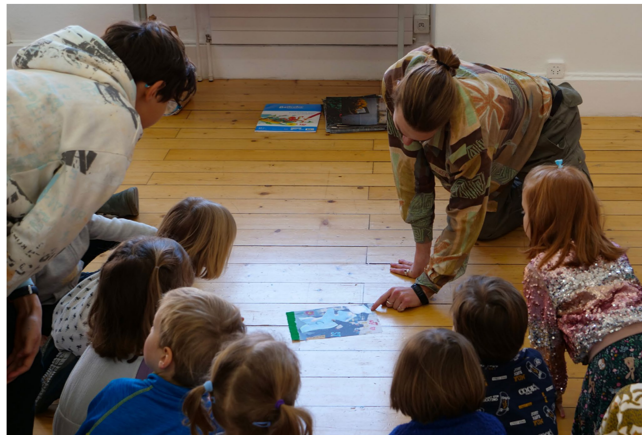
Kids Afternoon, 2025.

Die Kunstzentren haben nicht die Aufgabe, Sammlungen aufzubauen. Einige von ihnen verfügen jedoch über ständige Werkbestände. Während die meisten Kunstzentren einen allgemeinen Ansatz für zeitgenössische Kunst verfolgen, haben sich einige auf Fotografie, Design, Druckkunst oder Mode spezialisiert.