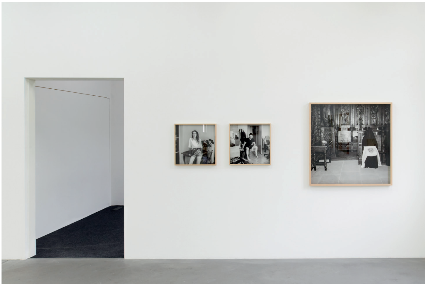
Vue d'exposition, Thomas Kern, je te regarde et tu dis , Fri Art, 2020.