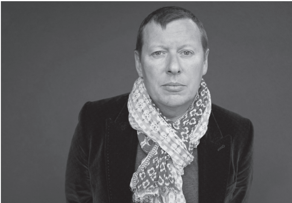
Thomas Kern © Tous droits réservés - Luca Zanetti

Thomas Kern ist zweifacher Gewinner des World Press Awards und erhielt mehrere Eidgenössische Stipendien. Seine Arbeiten sind in zahlreichen Sammlungen vertreten und wurde u.a. in der Galerie Stephan Witschi (Zürich), der Rathaus Galerie (Kunstkommission Aarau), der Fotostiftung Schweiz (Winterthur), dem Fotomuseum (Winterthur) und den Rencontres de Photographie d'Arles in Frankreich ausgestellt.