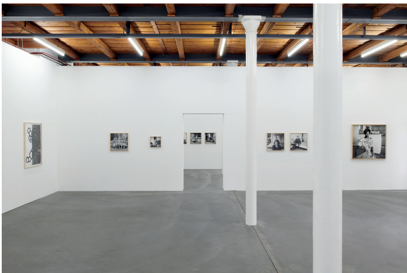
Vue d'exposition, Thomas Kern, je te regarde et tu dis , Fri Art, 2020.

Die Kunsthalle zeigt eine Ausstellung von Thomas Kern, dem Gewinner der 12. Ausgabe der Fotografischen Ermittlung, die vom Kulturamt des Kantons Freiburg ausgeschrieben wurde. Das Projekt des Aargauer Fotografen, zweimaliger Gewinner des World Press Awards, bestand darin die Einwohnerinnen und Einwohner des Kantons zu treffen. In den letzten Monaten entstanden so mehr als 60 Schwarz-Weiss-Porträts, von denen etwa 30 in der Ausstellung gezeigt werden. Die Portraits strahlen eine Gelassenheit aus, die das Nachdenken über menschliche Begegnungen und das Gefühl eines gemeinsamen Augenblicks anregen.