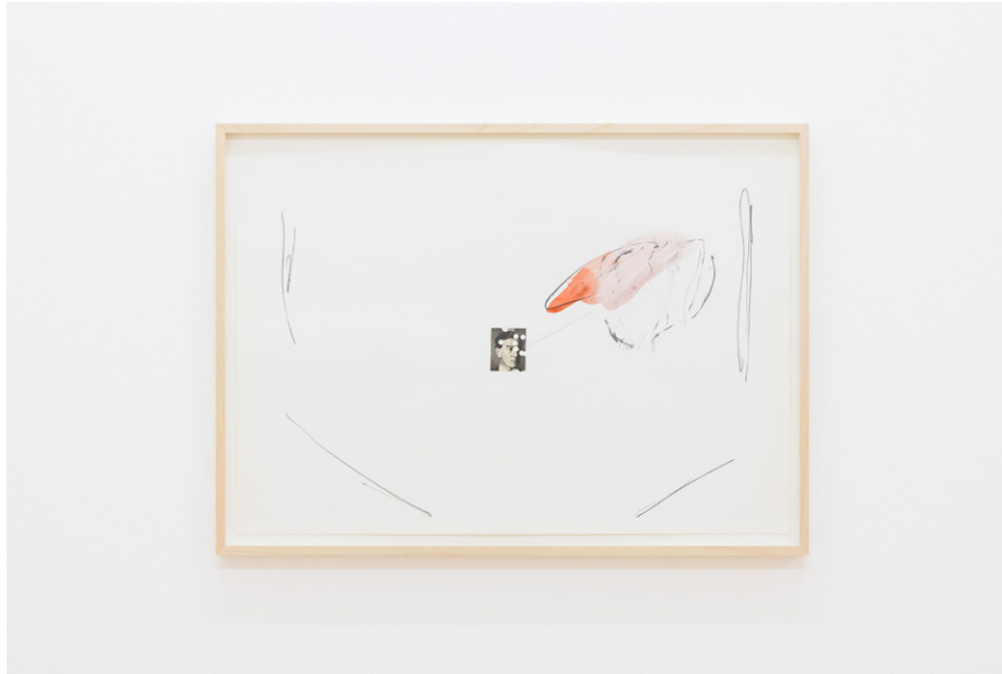
Michel Ritter, Sans titre , ca. 1978. © Succession Michel Ritter, Paris.

Les œuvres donnent une place importante au vide, à l'espace libre. Les matériaux mobilisés donnent corps à l'air, au souffle, priorisant l'éthéré et l'état gazeux. Cet état limite de la matière symbolise le devenir immatériel de l'image, mais aussi l'inactualité à venir de chaque nouvelle image. Cette déréalisation romantique nous met face à une justice poétique silencieuse qui vient couvrir la dimension militante d'une œuvre mise en mouvement par l'impuissance face aux scandales du présent.