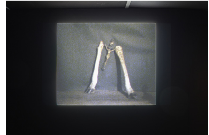
Michel Ritter, 3 Films d'animation, Sans titre, 6'26", date inconnue, vue d'installation Air Power = Peace Power , Kunsthalle Friart Fribourg, 2021. © Succession Michel Ritter, Paris. Photo Guillaume Python