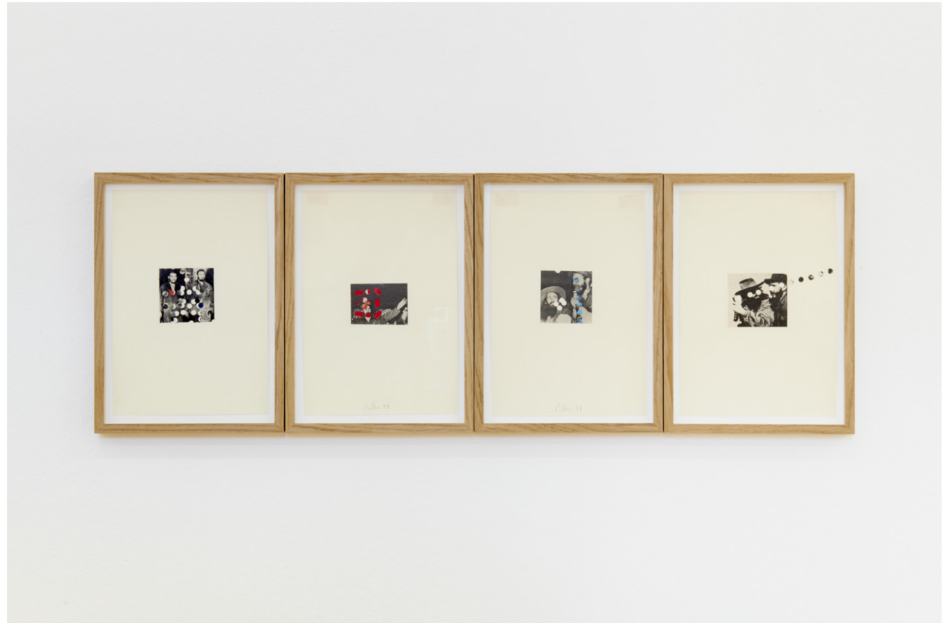
Vue d'exposition, Michel Ritter, Air Power = Peace Power , Kunsthalle Friart Fribourg, 2021. © Succession Michel Ritter, Paris. Photo : Guillaume Pyhton

L'exposition que lui consacre Friart est la plus importante de l'artiste à ce jour. Son oeuvre est actuellement gérée par Dorota Dolega-Ritter responsable de la Succession Michel Ritter (Paris).