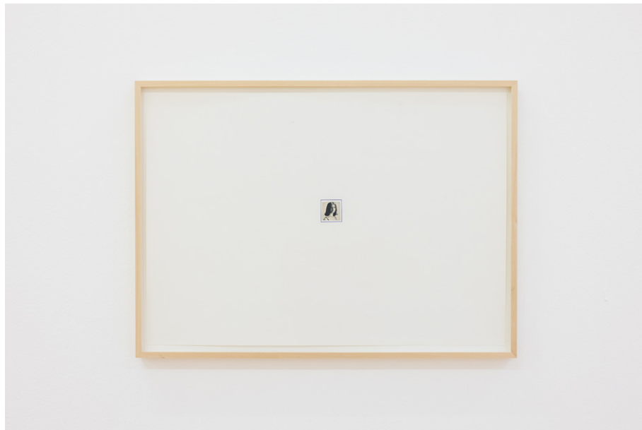
Michel Ritter, Sans titre , date inconnue. © Succession Michel Ritter, Paris. Photo : Julie Folly