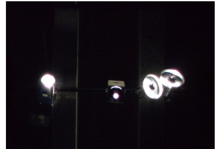
Michel Ritter, Lumières , 1982, 2'25". © Succession Michel Ritter, Paris