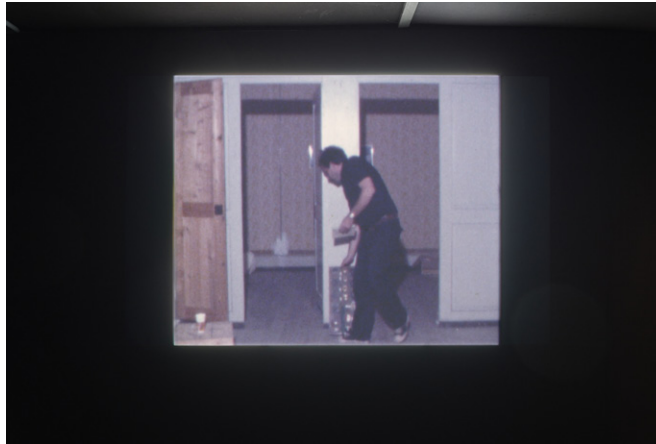
Michel Ritter, Sans titre, 2'9", Fri-Art 81, vue d'installation Air Power = Peace Power , Kunsthalle Friart Fribourg, 2021. © Succession Michel Ritter, Paris.