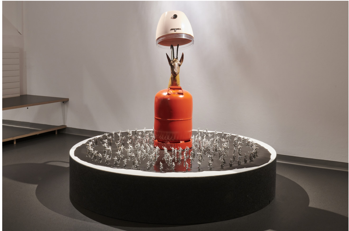
Michel Ritter, Sans titre , ca. 1990, vue d'installation Air Power = Peace Power , Kunsthalle Friart Fribourg, 2021. Courtesy of Olivier Suter. © Succession Michel Ritter, Paris. Photo : Guillaume Pyhton

Le titre de l'exposition Air Power = Peace Power est tiré d'un slogan pour une campagne de recrutement de l'armée de l'air américaine ; un panneau que l'artiste a ramené dans ses valises lors d'un de ses séjours aux États-Unis. Ce détournement et l'inversion de sens qui en découle une fois inséré dans ce contexte artistique rappelle le jeu omniprésent dans l'art de Michel Ritter où la critique de la domination de l'espace est toujours aussi un art poétique.