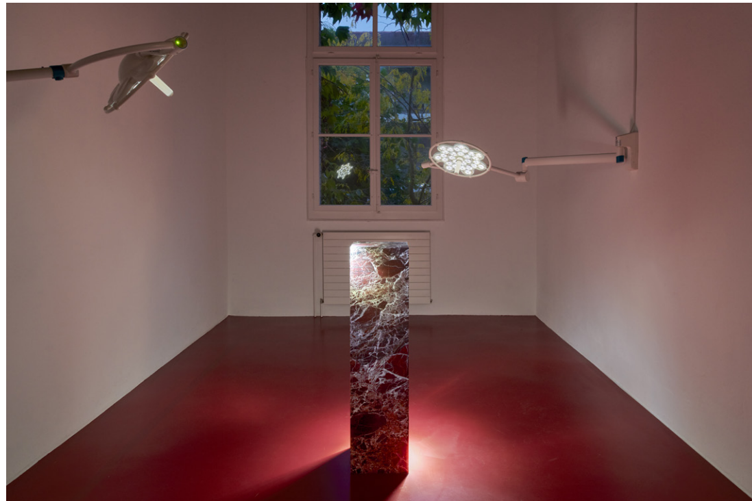
Vue d'exposition, Ceylan Oztruk, Matter of non , Kunsthalle Friart Fribourg, 2021.

L'exposition est accompagnée d'un texte en prose écrit par Ceylan Öztrük, qui rassemble des indices dans un espace narratif qui lui est propre. Trouvant son chemin diffracté à travers le langage et la matière, l'espacement, en tant qu'idée et pratique, fonctionne de manière allégorique.