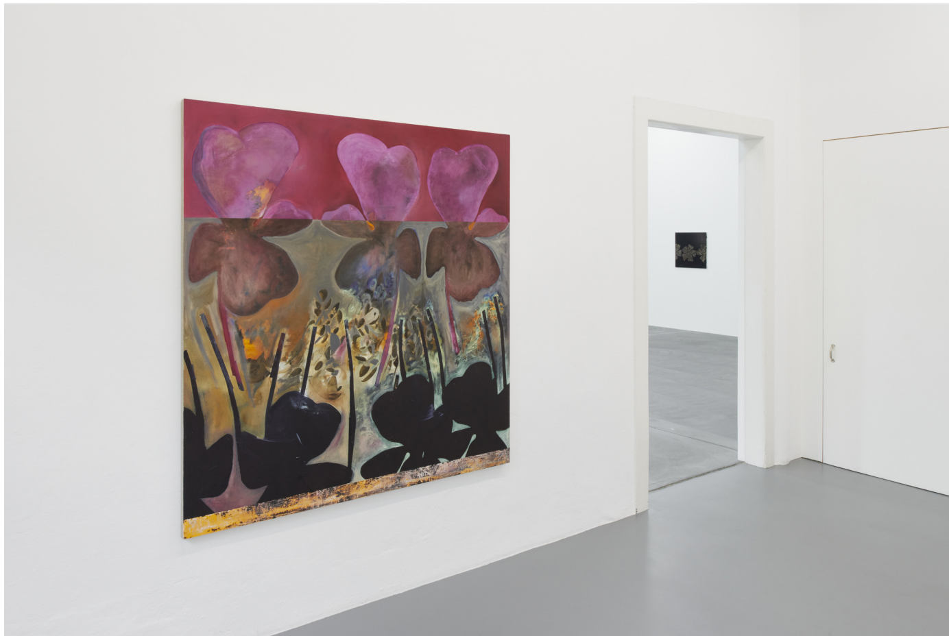
Exhibition view, Nora Kapfer , Kunsthalle Friart Fribourg, 2022

Programme complet Gesamtes Programm Complete program www.friart.ch