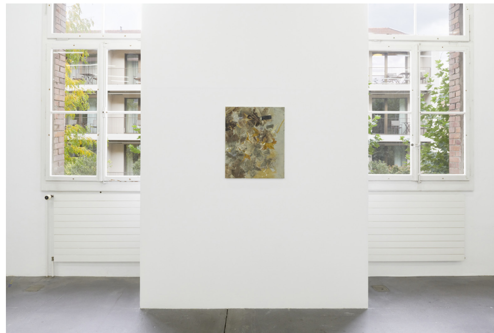
Nora Kapfer, Untitled (Oleander III) , 2021.