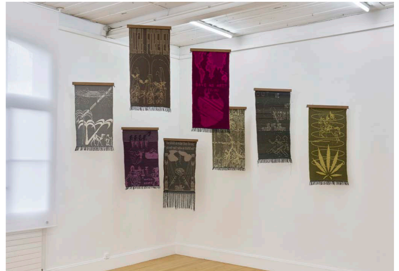
Exhibition view, Charlotte Johannesson, Save as art? , Kunsthalle Friart Fribourg, 2023.

The exhibition also includes a selection of screened digital images in the form of slideshows, as well as a display of archives that help to understand the pioneering and experimental nature of her production.