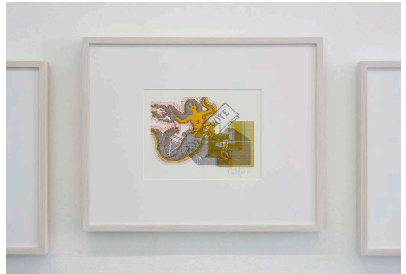
Charlotte Johannesson, Vote , 1984.