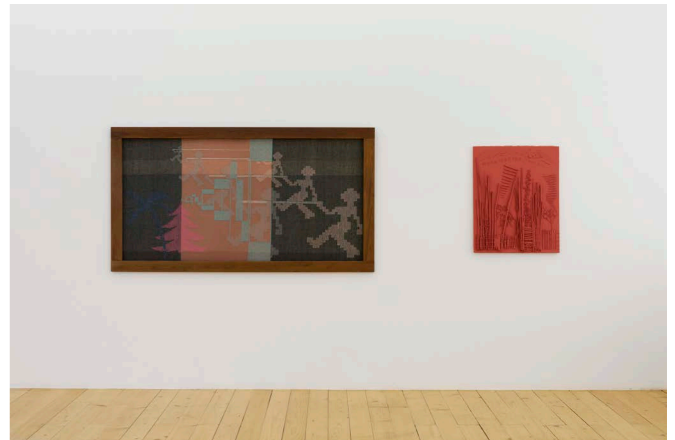
Installation view, Charlotte Johannesson, Longing , c. 1970 ; More Matter, Less Art , 2018, Kunsthalle Friart Fribourg, 2023.