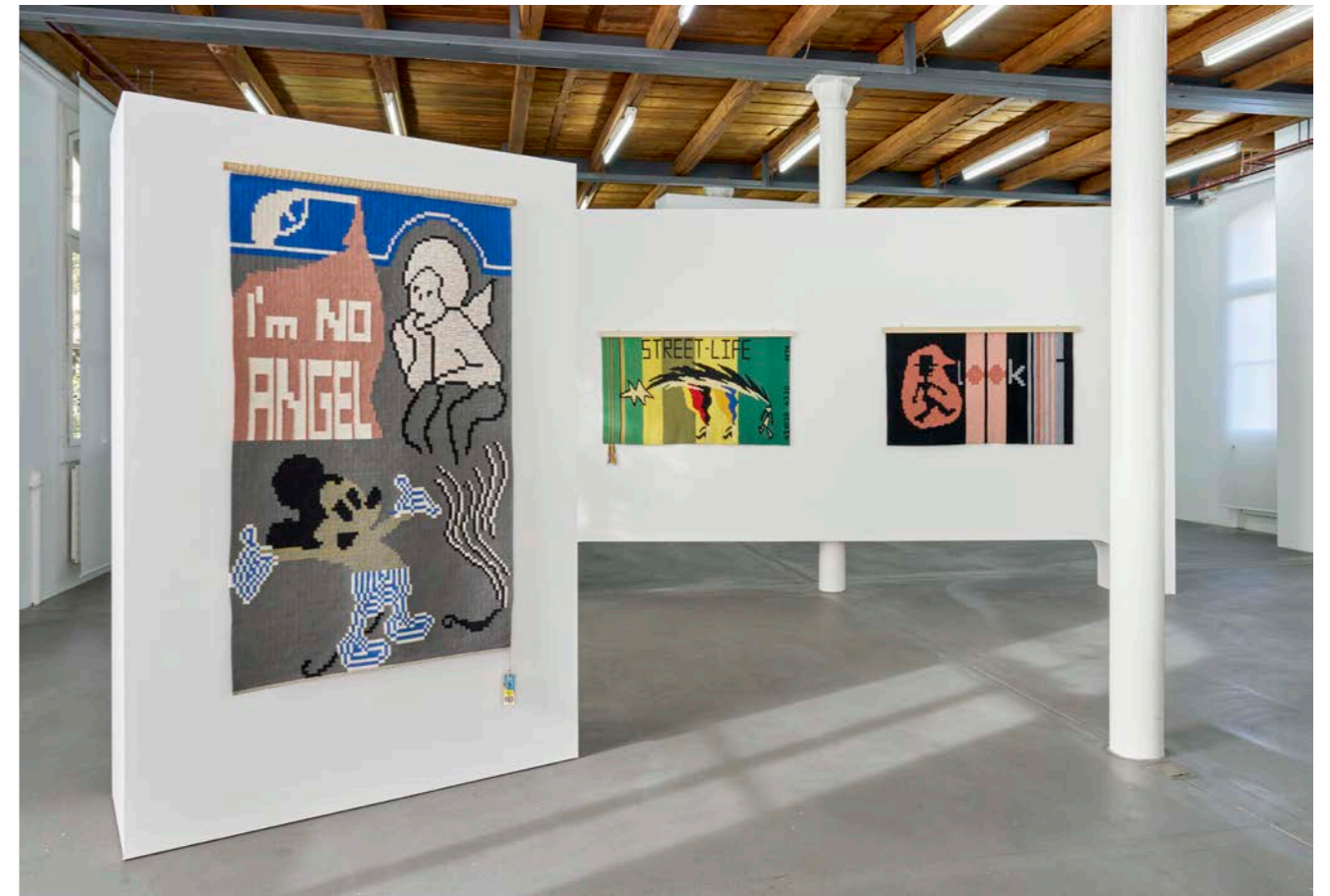
Exhibition view, Charlotte Johannesson, Save as art? , Kunsthalle Friart Fribourg, 2023.