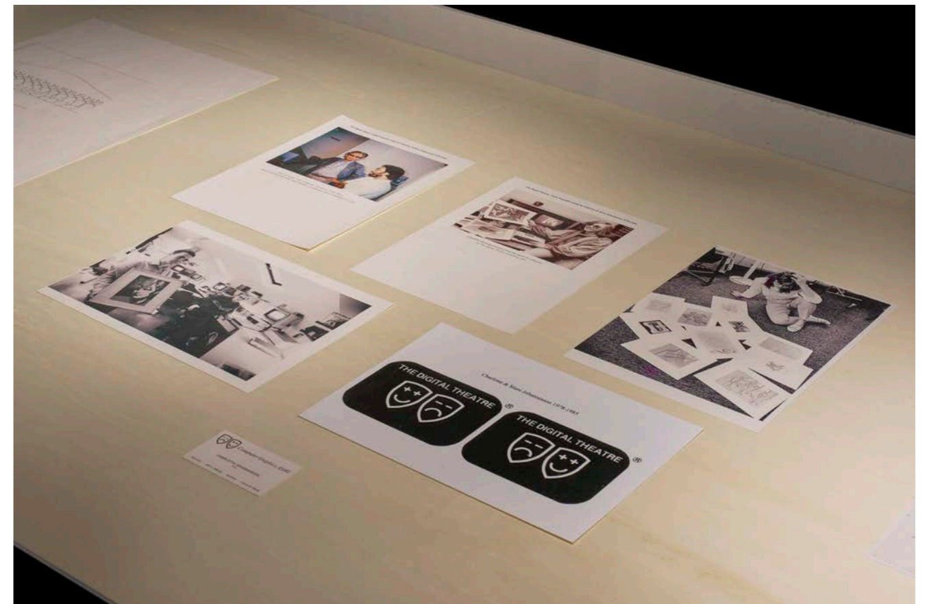
Display case, Archives Digital Theatre, Charlotte Johannesson, Save as art? , Kunsthalle Friart Fribourg, 2023.