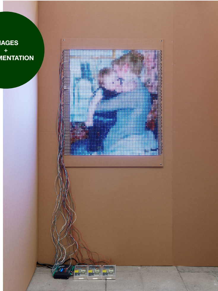
Exhibition view, Ei Arakawa, Don't Give up , Overduin & CO., Los Angeles, 2022