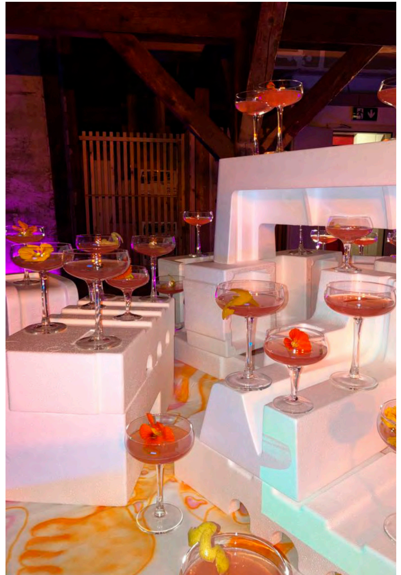
Hot Hot Hot, Splatz , Space Fest 2, 2022

To accompany this expanded vision of the arts, the exhibition space of the Petites-Rames 22 industrial building will reveal traces of its history, from the cardboard factory (1896–1936) to a shelter for the most destitute (1936–1989). The Kunsthalle invites you to engage in a deeper time that dissolves the boundaries of consumption.