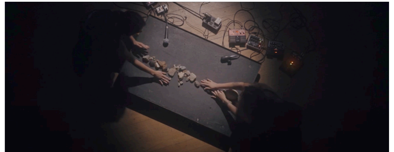
Fronte Violeta, Hush , 2022, still de la vidéo (18'25'/sound composition)