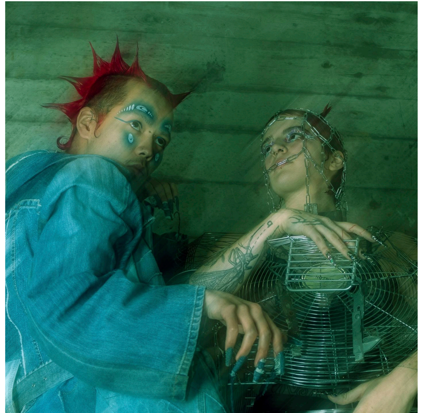
Club de Fôret.

Der experimentelle Künstler:in Min ReCuliao rundet den Klangabend im Keller von Friart mit einer Exploration mentaler Landschaften in Ton und Bild ab. Eine weitläufige Landschaft auf globaler Ebene, die reich an vielfältigen Einflüssen ist.