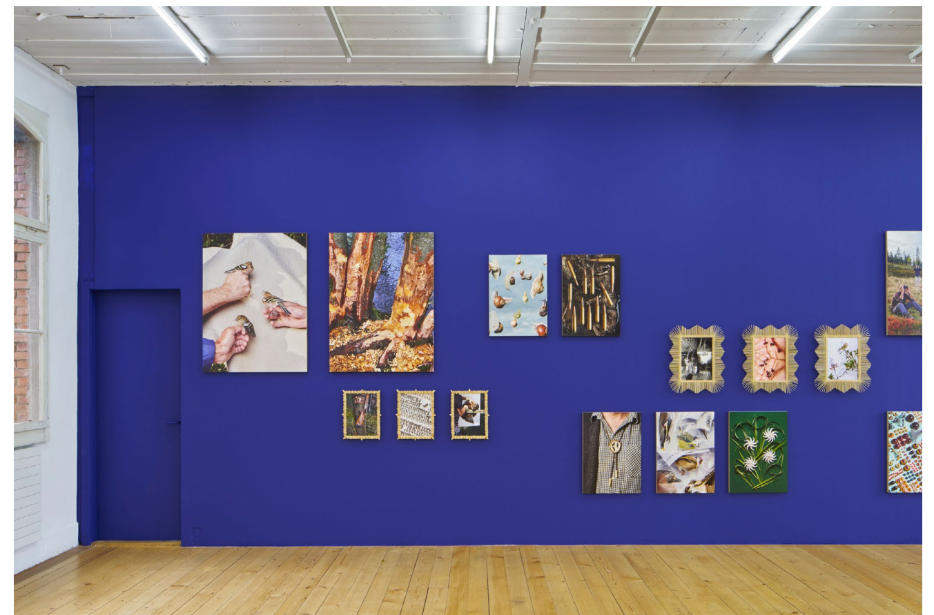
Exhibition view, Laurence Kubski, Sauvages , Kunsthalle Friart Fribourg, 2024.

The 14th edition of the Fribourg photographic survey is a competition Service de la culture de l'État de Fribourg.