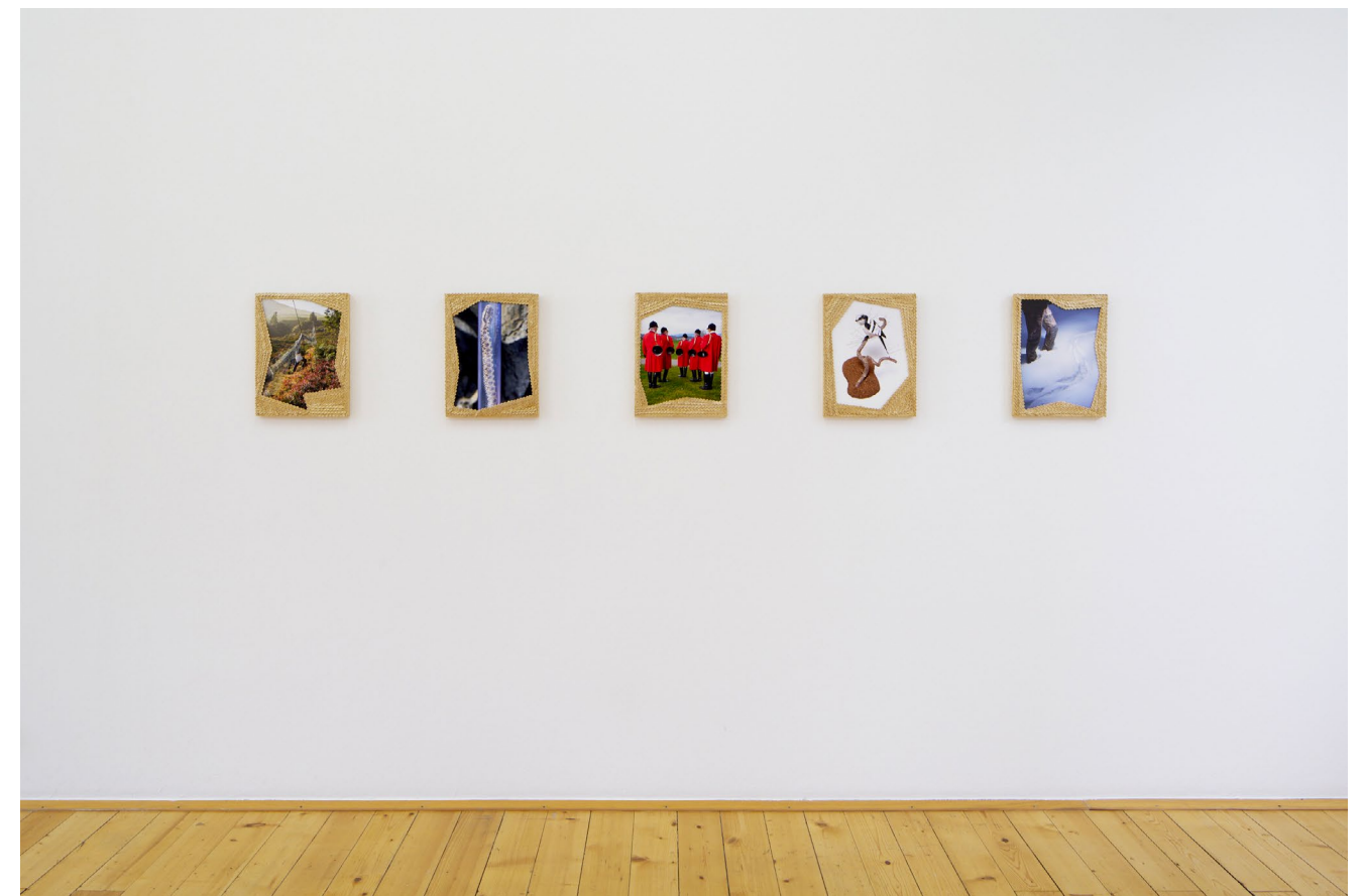
Installation view, Laurence Kubski, Sauvages , Kunsthalle Friart Fribourg, 2024.